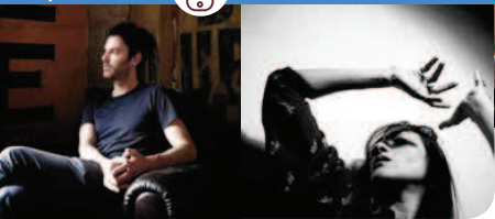
VINCENT PEIRANI QUINTET

Accessibles aux personnes à mobilité réduite.