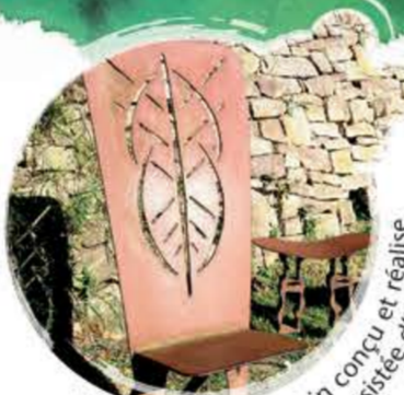
Mobilier contemporain conçu et réalisé par Béatrice Massa assistée d'Eric Dartois